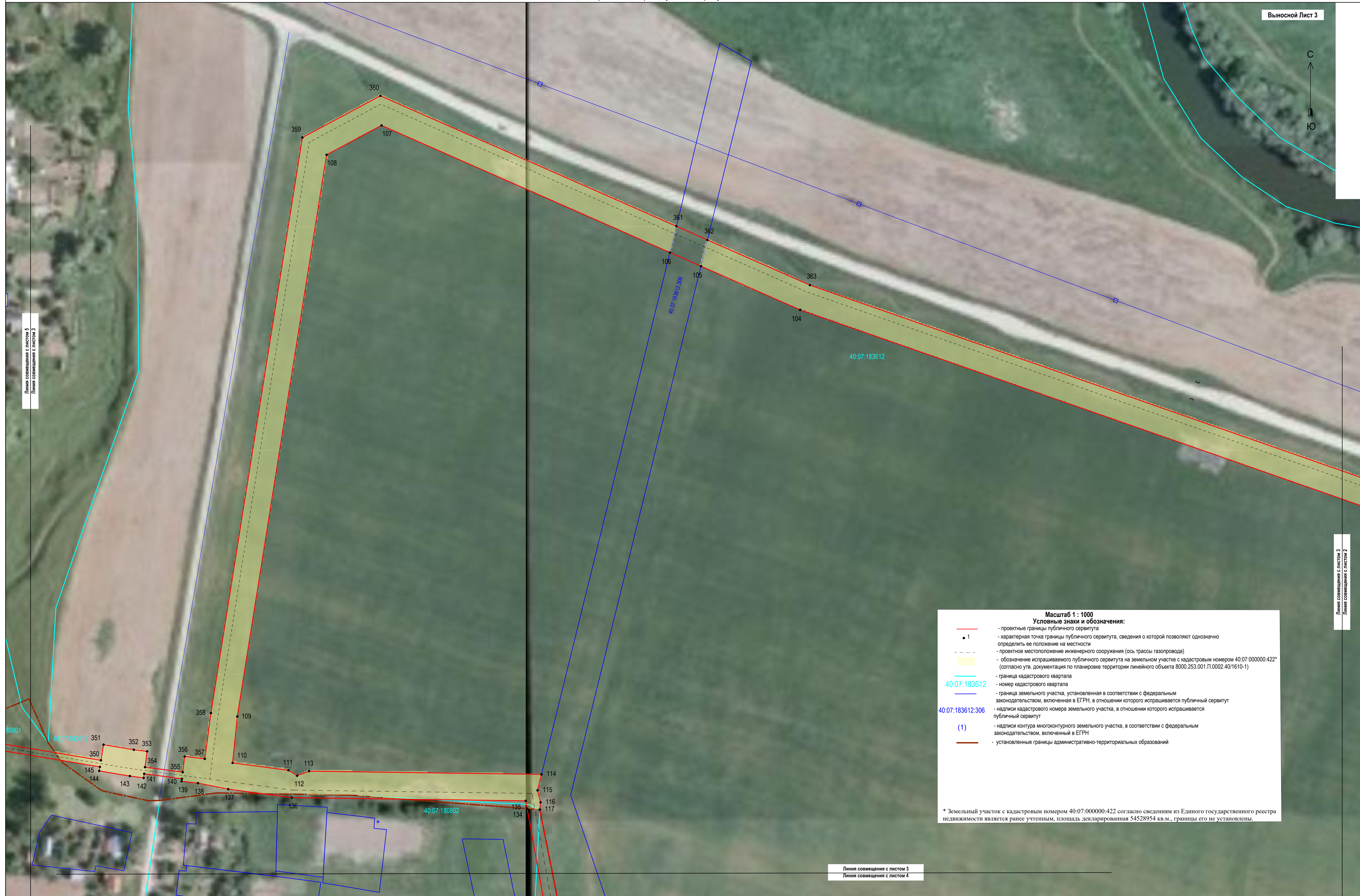
Раздел 4 Схема расположения границ публичного сервитута