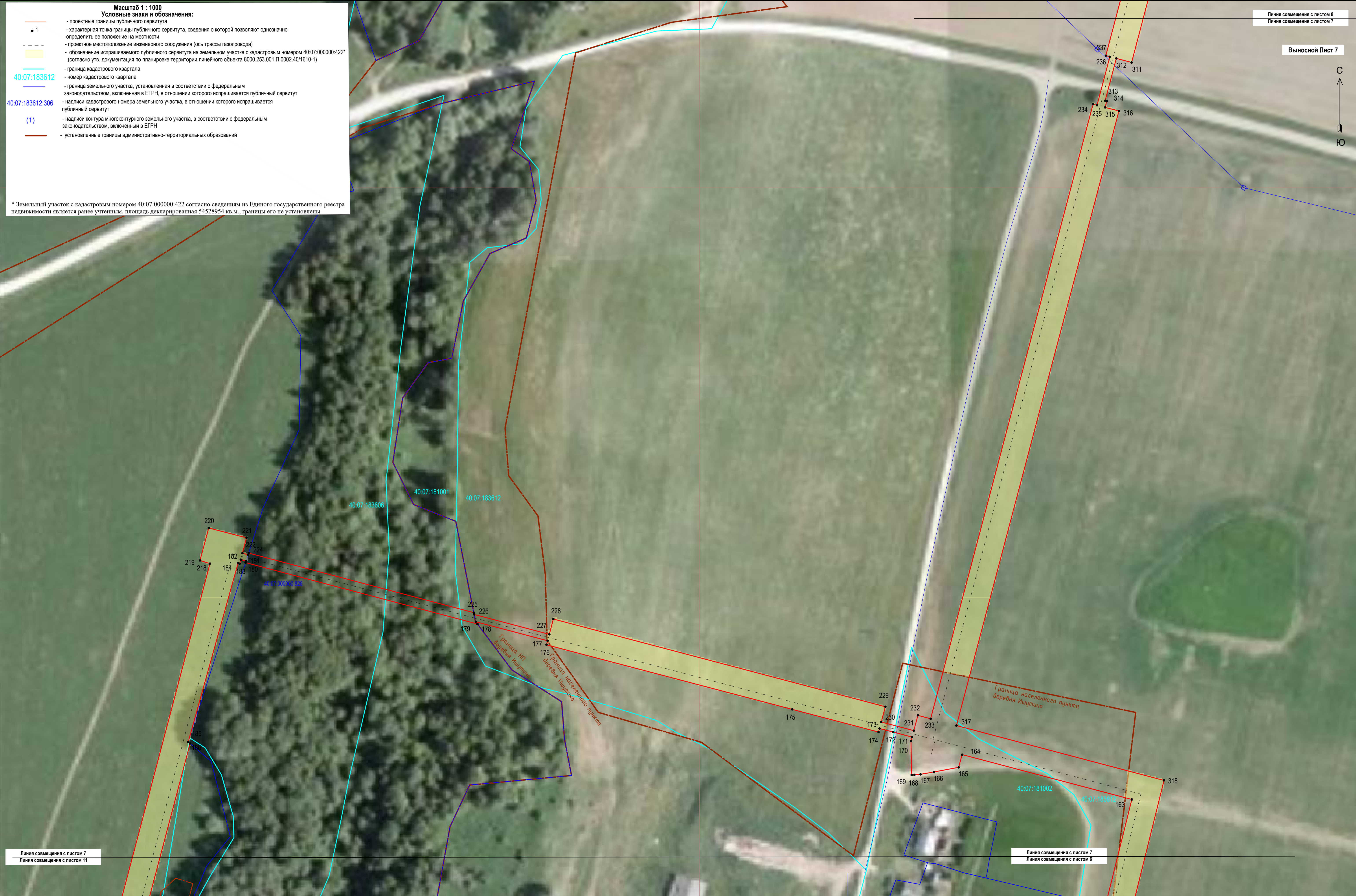
Раздел 4 Схема расположения границ публичного сервитута